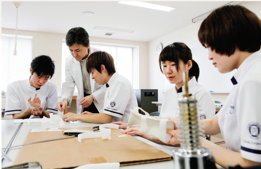
ハンドセラピーの授業場面