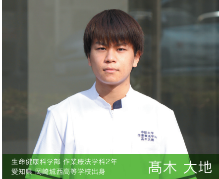
生命健康科学部 作業療法学科2年 愛知県 岡崎城西高等学校出身