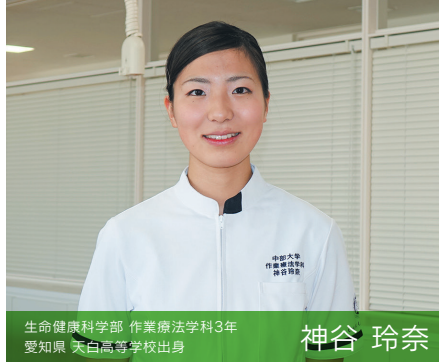
生命健康科学部 作業療法学科3年 愛知県 天白高等学校出身

『病理学』では、がんや炎症など人間の主要な病気について学びました。病名を聞いたことはあっても、原因や症状は初めて知ることばかり。患者さんの病態を評価するために必要なことを学びました。中部大学は実習が充実しているうえに、授業外でも骨模型を使って自習できるなど恵まれた環境なので、知識も技術も磨いていきたいと思っています。