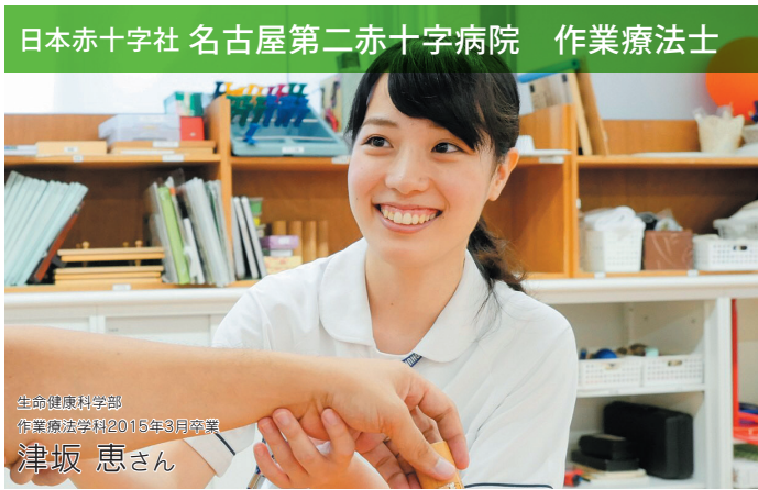
日本赤十字社 名古屋第二赤十字病院 作業療法士