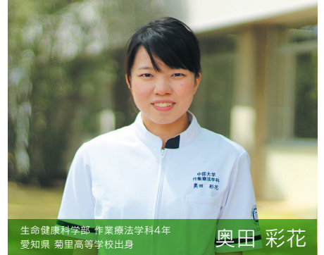
生命健康科学部 作業療法学科4年 愛知県 菊里高等学校出身

1年次から多くの現場を体験できました。病院や施設を計5か所も見学させていただけたんです。まだ専門的なことは理解できなくても、「作業療法士さんが触っているのはどの筋肉かな」と考えて、講義での学びとリンクさせられる貴重な時間になりました。広い視野で作業療法を考えられるよう、意識を高く持って学びたいと決意を新たにしました。