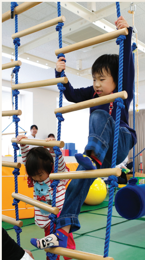
手や足を上手く組み合わせて使うことを学びます。

作業療法では、(描くこと歌うことだけでなく)生きるためにすることすべてが「作業」だと考えます。それだけに作業療法士とは、病院の中だけではできない、大きな広がりのある仕事なのです。