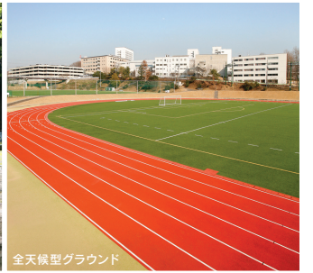
全天候型グラウンド