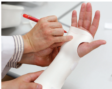
ハンドセラピーにおけるスプリント作製場面