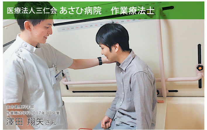
医療法人三仁会 あさひ病院 作業療法士

作業療法士には3つの力が必要だと、中部大学の先生は教えてくださいました。疾患に関する知識・評価・治療を行う技術、そして医療人として人の気持ちに寄り添う態度、すべてがそろってはじめて、患者さんと信頼関係を築くことができるのです。身につけた知識・技術・態度は、今の私の基盤になっています。どう治療すべきか悩む患者さんに出会ったときは、今でも教えてくださいました先生に相談して、より良い治療のヒントをいただいています。