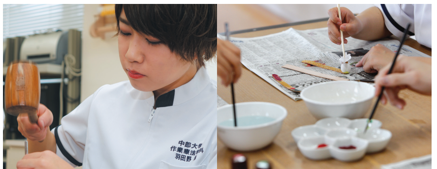
作業に取り組むことで気分転換や感情の安定をはかり、精神機能の回復を促します。