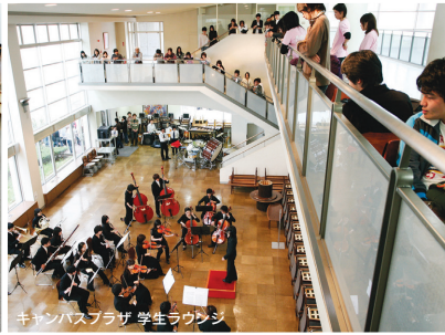
キャンパスプラザ 学生ラウンジ