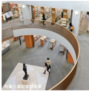
附属三浦記念図書館

地上7階建ての校舎・55号館（右）。作業療法学科、理学療法学科、臨床工学科の専用施設のほか、チーム医療を体験できる生命健康科学部全学科の実習施設も用意されています。