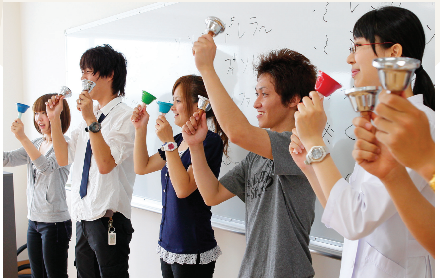
音楽を用いた作業療法の実習場面